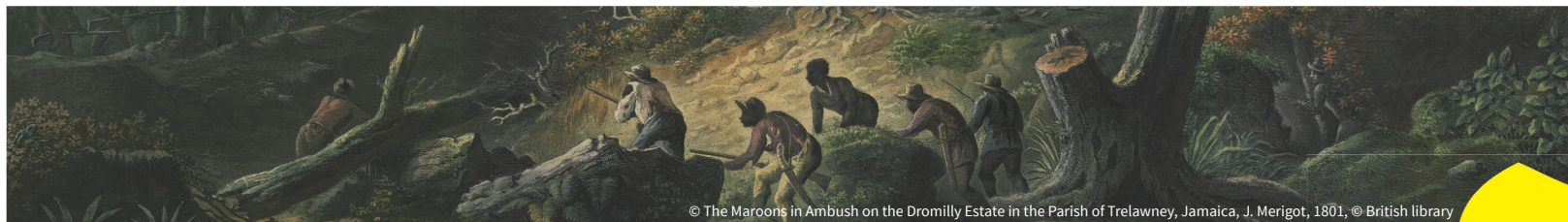
© The Maroons in Ambush on the Dromilly Estate in the Parish of Trelawney, Jamaica, J. Merigot, 1801, © British library

>> MARIE SEBILLOTTE , Doctorante en histoire, EHESS Paris, IMAF.