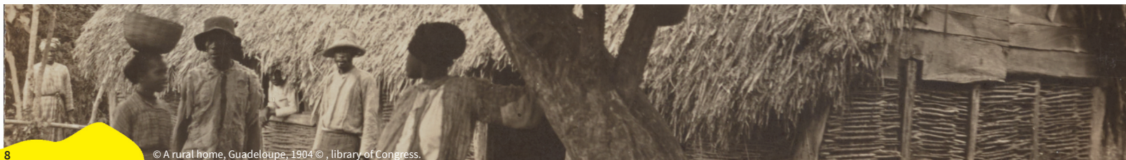
© A rural home, Guadeloupe, 1904