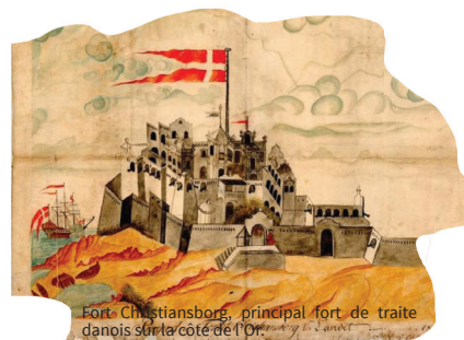
Fort Christiansborg, principal fort de traite danois sur la côte de l'Or.

Entre la fin du 17 e siècle et les premières décennies du 19 e siècle, les Danois et les Suédois, comme les autres Européens, participent à la traite négrière. Ce trafic stimule la fondation de comptoirs en Afrique et de colonies aux Antilles. Au-delà de la seule déportation de dizaines de milliers d'Africains, la traite négrière eut un réel impact sur les productions nationales et les échanges atlantiques des deux pays du Nord.